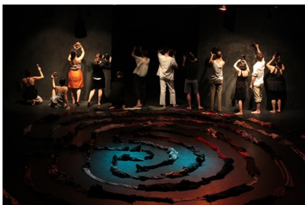
Into the labyrinth o Dónde está el minotauro, acaba igual que emoeiza, con los actores dando la espalda al público.

Sin duda Into the labyrinth o Dónde está el minotauro , es un hermoso trabajo de Gregorio Amicuzi , de los actores, y de todo el equipo técnico, que ha participado en este laboratorio de investigación y creación de Residui Teatro