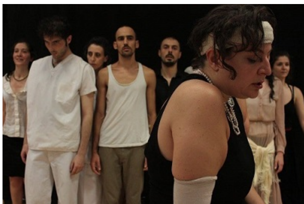
Into the labyrinth Dónde está el minotauro, dirigida por Gregorio Amicuzi

Una vez que todos los personajes se han significado de una manera individual dentro del laberinto. Se entrelazarán y bailarán una especie de Sirtaki, rimado como un mantra. Celebrando el ritual de la danza, que no es otra cosa, que la unión de los mortales en su fragilidad, saltando y alzando las manos hacía el cielo, para llamar la atención de ese dios, que nos creo y se marchó.