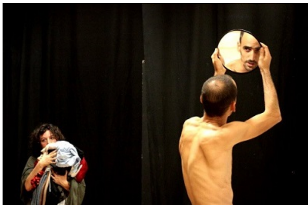
Into the labyrinth Dónde está el minotauro, dirigida por Gregorio Amicuzi

En "Into the labyrinth" - Dónde está el minotauro -, los actores reciben al público, de espaldas a este, frente a la pared del fondo del escenario. Se valen de espejos para mirar sin ser vistos, en el suelo como escenografía, lo que podría ser una instalación de arte povera , conforma los pasillos de un laberinto con ropas y zapatos.